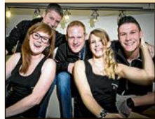
L'équipe de Bombastick